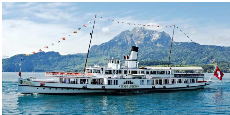
Dampfschiff «Stadt Luzern», Baujahr 1928, vor dem Pilatus, Schifffahrtsgesellschaft Vierwaldstättersee.