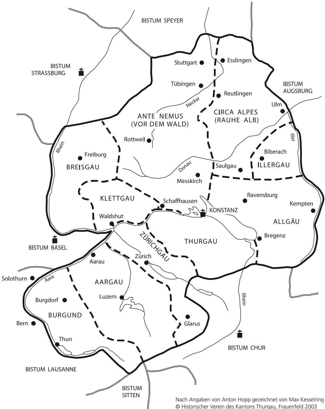
Karte 1: Archidiakonate im Bistum Konstanz 1275