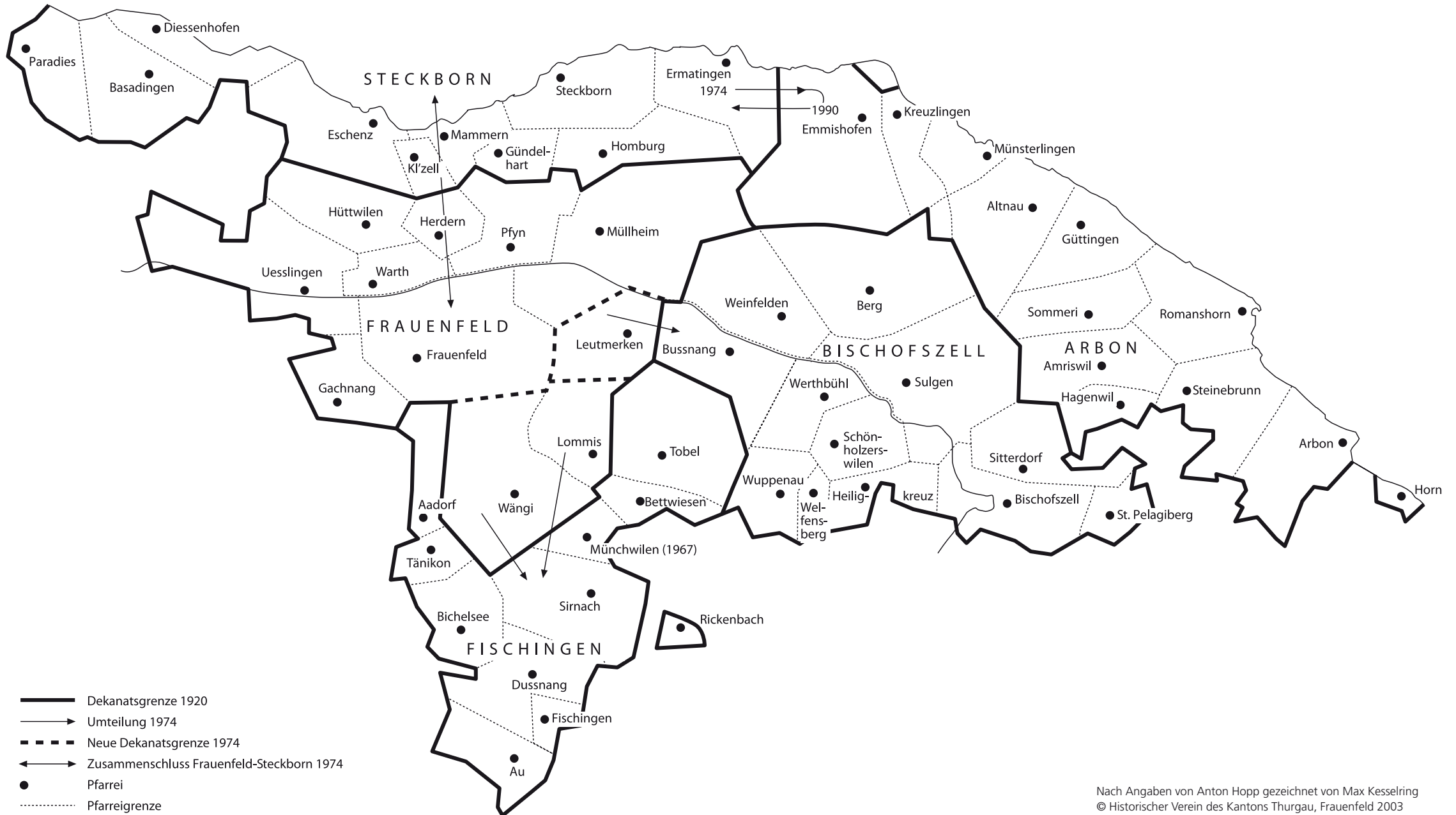
Karte 7: Thurgauische katholische Dekanate und Pfarreien seit 1920 mit Veränderungen 1974