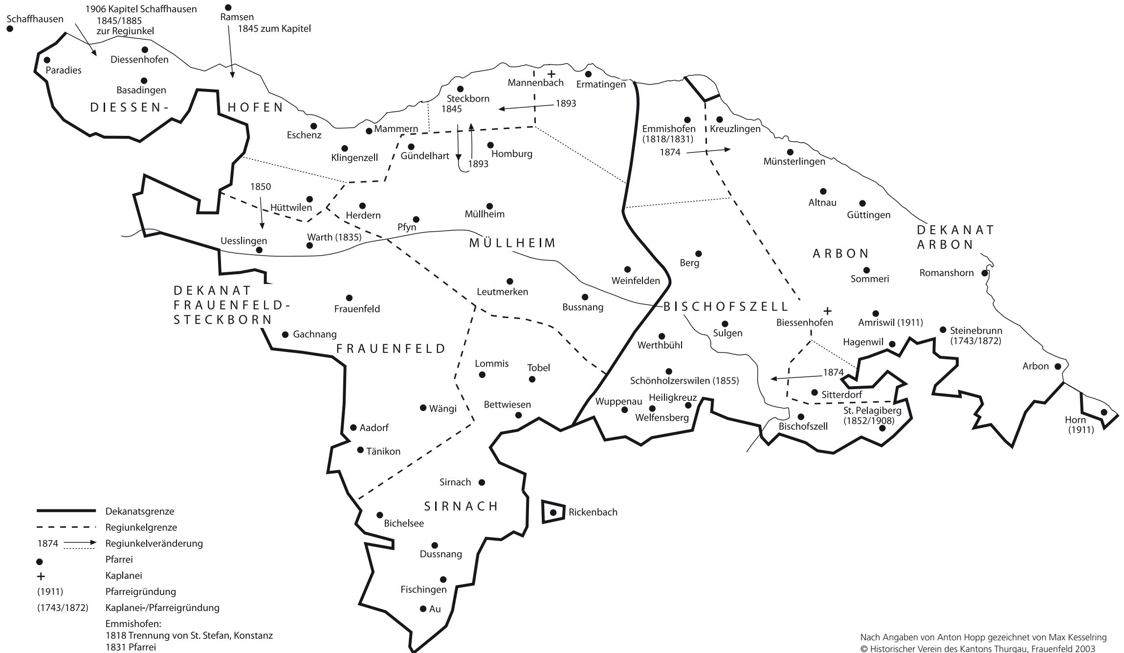
Karte 6: Thurgauische katholische Dekanate mit Regiunkeln und Pfarreien 1808–1920