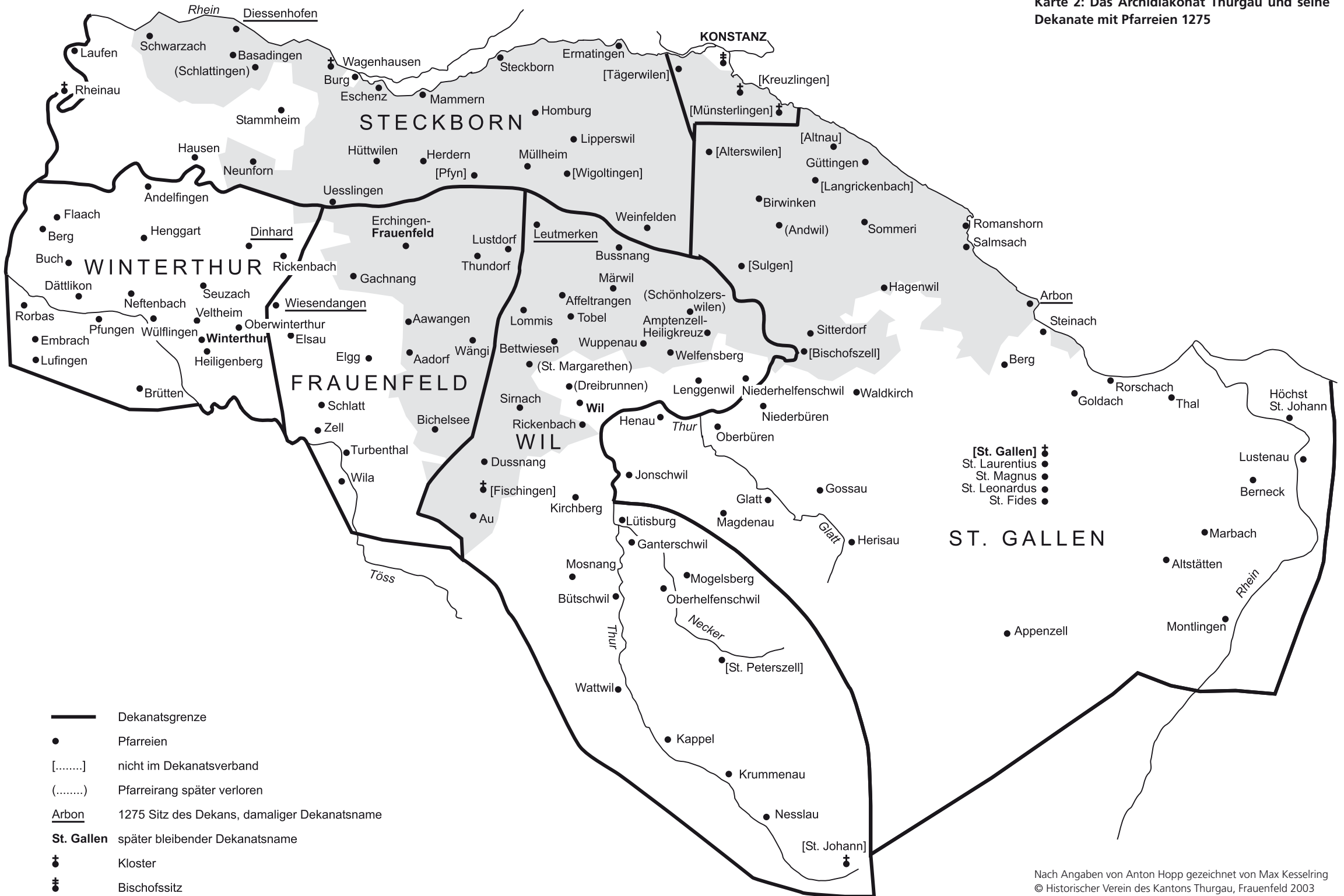
Karte 2: Das Archidiakonat Thurgau und seine Dekanate mit Pfarreien 1275