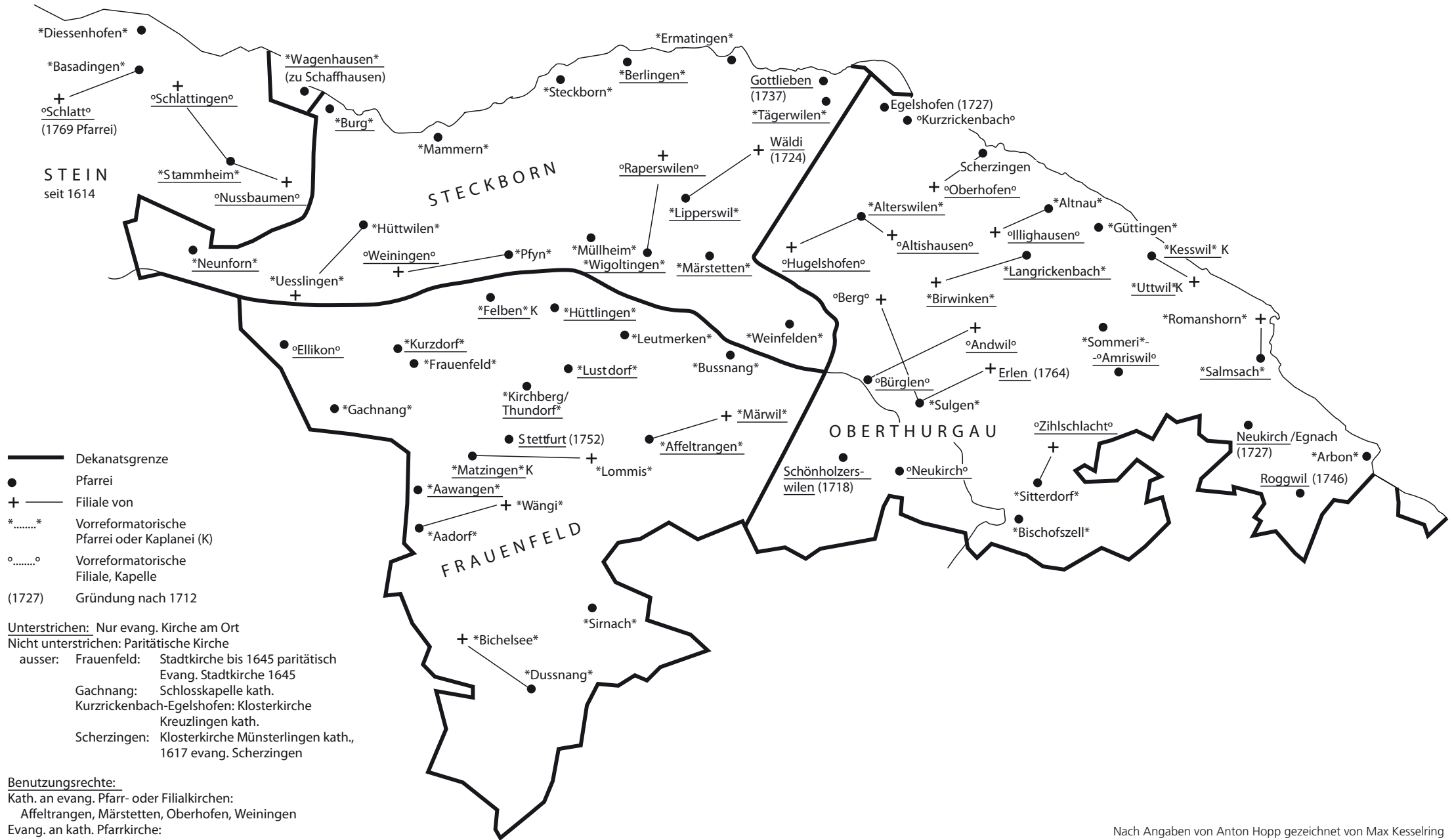
Karte 5: Thurgauische evangelische Dekanate und Pfarreien Ende des 18. Jahrhunderts