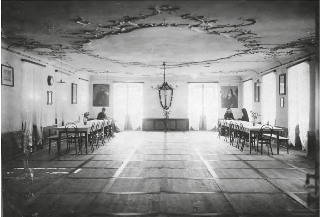
Abb. 22: Diese undatierte Aufnahme scheint auf der Bildebene zu bekräftigen, dass man sich nicht viel zu sagen hatte. Im gemeinsamen Aufenthaltsraum sitzen Patres und Schwestern getrennt an zwei Tischen, die kaum weiter auseinander stehen könnten.

alles nichts, deshalb sei eine Unordnung im Speisesaal. Auf das hin versuchte ich beiden verständlich zu machen, dass es für mich keinen Zweck habe, etwas zu sagen, solange sie im Schweigen und Gehorchen nicht anders als die Kinder selbst seien. [...] Wenn sie selbst unbeherr[s]cht sind und ständig auf die Kinder losschwatzen und schimpfen, reizt das jedes zum Widerspruch. Ordnete ich etwas an und wurde es von den Sr. nicht ausgeführt, so war meine Mühe umsonst.» 308