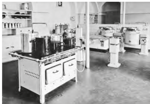
Abb. 15: Als 1940 die Küche renoviert werden musste, wurde die weltweit erste Holzgas-Grossküchenanlage eingerichtet, um «das Holz des eigenen Betriebes in ausgiebigster und billigster Art zu verwenden». Die unausgereifte Anlage war indes pannen anfällig und verursachte beim Küchenpersonal Kopfweh, so dass sie nach nur sieben Jahren ersetzt werden musste.

in den Orden und den gewandelten Anforderungen an Kinderheime stellte St. Iddazell seit den 1960er-Jahren jedoch vermehrt weltliches Personal ein, was den steilen Anstieg der Lohnkosten in dieser Zeit erklärt.