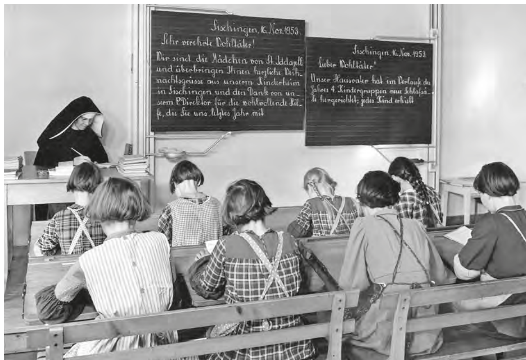
Abb. 17: St. Iddazell war stets auf Spenden angewiesen. Wie diese Aufnahme von 1953 zeigt, mussten die Schülerinnen und Schüler Bettelbriefe mit vorgegebenem Text an potenzielle «Wohltäter» verfassen.