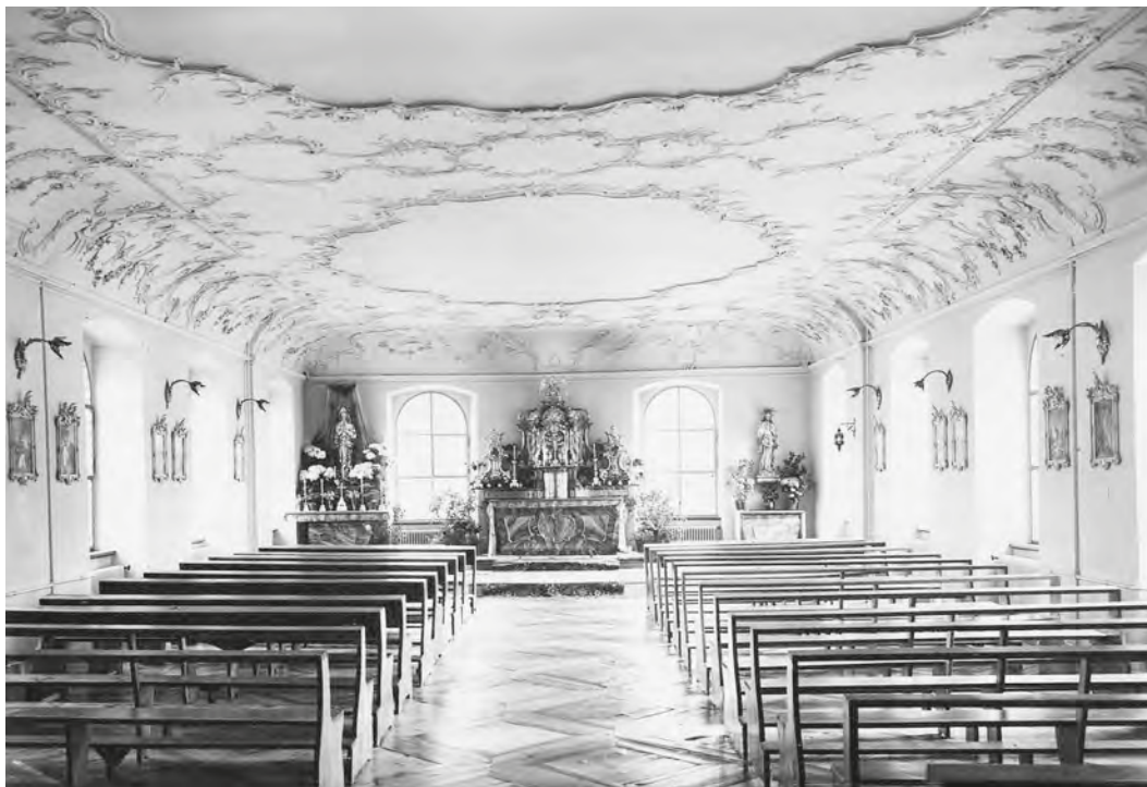
Abb. 36: An den Wochentagen in den Wintermonaten wurde die Frühmesse in der Hauskapelle abgehalten.

Für «die Sorge und Pflege der geistigen und speziell der religiösen Erziehung der Heimkinder» war ein Katechet zuständig. Er gab Religionsunterricht und war Seelsorger, amtierte aber auch als Präfekt der