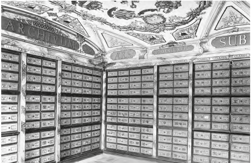
Abb. 1: In den Schubladen des ehemaligen Klosterarchivs wurde bis 2013 ein Grossteil der Dossiers mit den Zöglingsakten des Kinderheims St. Iddazell aufbewahrt.

Wertungen über eine Person eine Eigendynamik entwickeln und so zu einer Stigmatisierung des oder der Betroffenen beitragen können, ist bekannt. 17 Dieser Vorgang lässt sich vielfach auch in St. Iddazeller Akten aufzeigen, indem etwa beim Eintritt ins Heim im Aufnahmebogen notierte Charakterisierungen, die von dritter Seite stammten, in Führungsberichten fortgeschrieben wurden und schliesslich alles, was jemals über den Zögling wertend berichtet wurde, Eingang in den Abschlussbericht fand. Dieser liest sich dann wie eine komprimierte Kompilation sämtlicher jemals verfasster Berichte und ist entsprechend widersprüchlich. 18