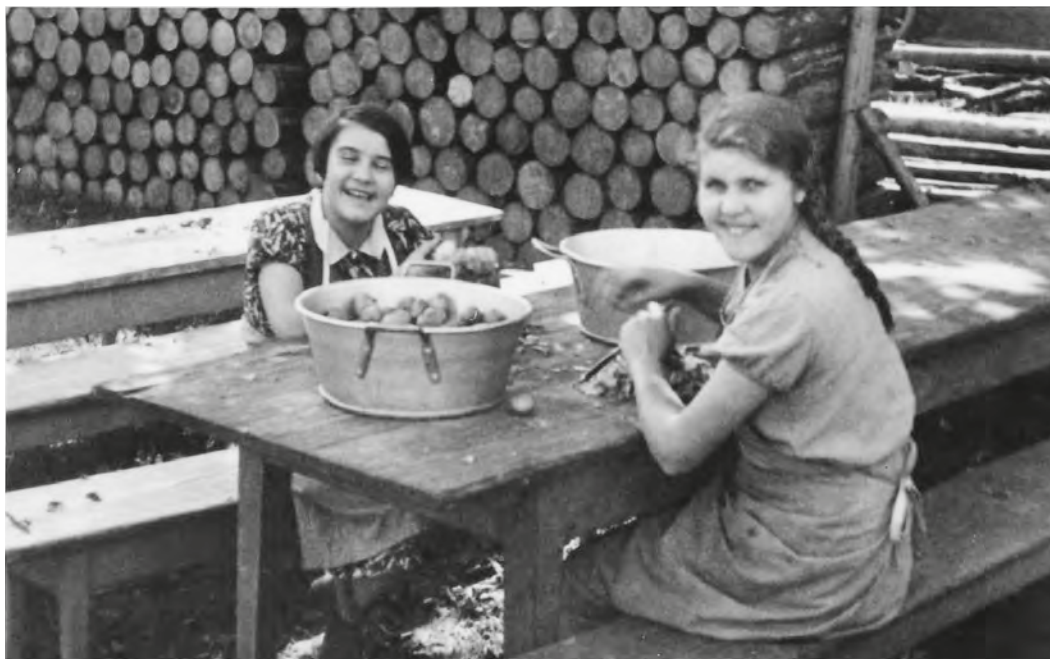
Abb. 27 bis 29: Das Verrichten sogenannter Ämtli in Haus, Küche und Garten gehörte lange Zeit ganz selbstverständlich zum Alltag der Heimkinder. Bis in die 1960er-Jahre wurden die Kinder und Jugendlichen auch als Arbeitskräfte in der Landwirtschaft eingesetzt. In den Spitzenzeiten, vor allem während der Heuernte, blieb die Schule geschlossen. Aufnahmen um 1940.

Zeit selbstverständlich, ja, galt als pädagogisch wertvoll. So heisst es im Jahresbericht 1944/45: «Die Besorgung der Hausämtdchen: Wischen, Schuhe- und Kleider-Reinigen; die Beziehung zum Küchendienst; Gemüse-Rüsten und Geschirr-Abwaschen; Arbeiten auf dem Feld: Kartoffeln-Setzen und Ausgraben, heuen und ernten; Gartenarbeiten usw. das alles sind Mittel, den Sinn für Ordnung und Sauberkeit beizubringen, Sinn für Arbeitsamkeit und Freude an der Arbeit zu wecken.» 403 Die sogenannten Ämtli begannen am Morgen gleich nach dem Frühstück. Dann wurde «überall Ordnung gemacht: im Schlafsaal, auf den Stiegen, in den Gängen. Einzelne werden abkommandiert zum Holz und Kohlen tragen». 404