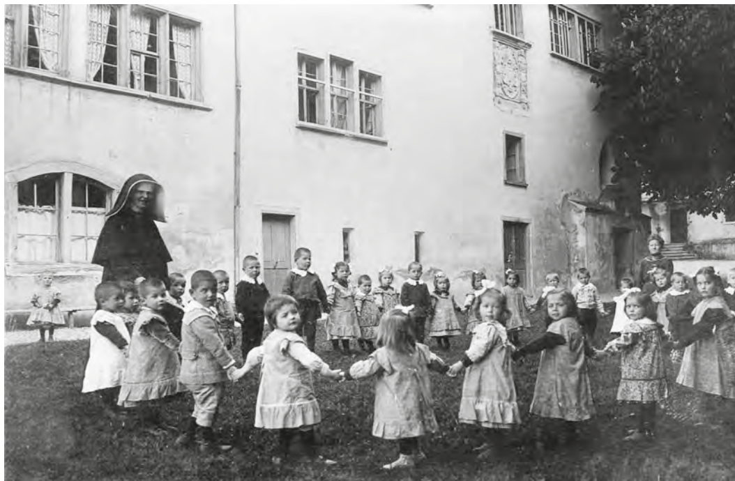
Abb. 38: Die Menzinger Schwestern waren in St. Iddazell für den Betrieb des Heims in Küche und Wäscherei zuständig und betreuten als Erzieherinnen die Säuglinge, Kleinkinder sowie die Kinder im Kindergarten- und Primarschulalter.

men und nachts Kontrollgänge machen. 786 Diese größere Arbeitsbelastung machte die Arbeit in einem Kinderheim für weltliche Lehrpersonen weniger attraktiv.