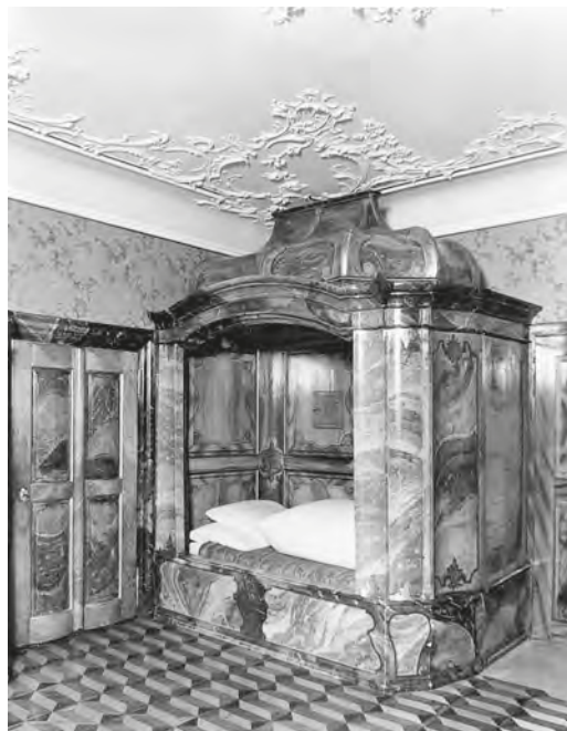
Abb. 19 und 20: Das hierarchische Gefälle im Heim manifestierte sich auch in den unterschiedlichen Schlafgelegenheiten. Während der Direktor in einem prunkvollen Himmelbett nächtigte (Abb. 19), verbrachten die Erzieherinnen die Nacht in einem kastenartigen Verschlag im Schlafsaal der Kinder (Abb. 20).

Menzingen von 1920 Auskunft gibt: Einzig in die «Angelegenheiten des Ordenslebens der Schwestern» durfte er sich nicht einmischen. 290 Den Schwestern wurden im Vertrag «ihrem Stande angemessene möblierte Wohnungsgelegenheiten, ferner genügende und kräftige Kost, Licht, Heizung, Wäsche und eine jährliche Barentschädigung von Fr. 300» zugesichert. 291 Weiter hatten sie Anrecht auf genügend Zeit zur «freien und ungehinderten Verrichtung ihrer vorgeschriebenen Andachtsübungen». 292 Auch von einer jährlichen Erholungszeit im Rahmen von 8 bis 14 Tagen war die Rede, die den Schwestern «wenn nötig» gestattet werden sollte. 293