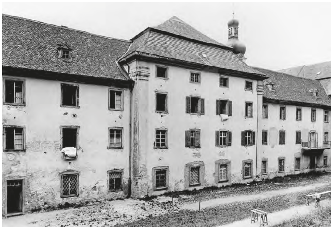
Abb. 16: Angesichts der chronisch knappen Mittel befanden sich grosse Teile der Anstalt in einem baulich deplorablen Zustand, wie diese Aufnahme von 1962 dokumentiert.

nen, fiel zwanzig Jahre später der betreffende Lohnposten deutlich höher aus. Die Differenz aus den Einnahmen und den Ausgaben der Patres gab der Direktor an das Kloster Engelberg ab, und das waren im Schuljahr 1966/67 immerhin rund 35 000 Franken. 267