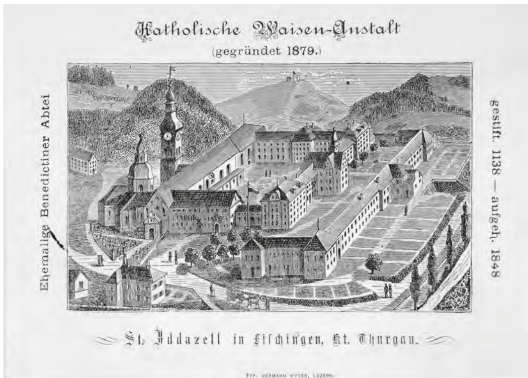
Abb. 4: Die Waisenanstalt St. Iddazell um 1880. Planvedute auf einem Prospekt der Anstalt.

gebäulichkeiten. Damit wurde der Weg geebnet für anderweitige Nutzungen, namentlich die Wiedererichtung eines Benediktinerklosters, was spätestens seit der Ankunft der Engelberger Patres 1943 ein erklärtes Ziel war. 63