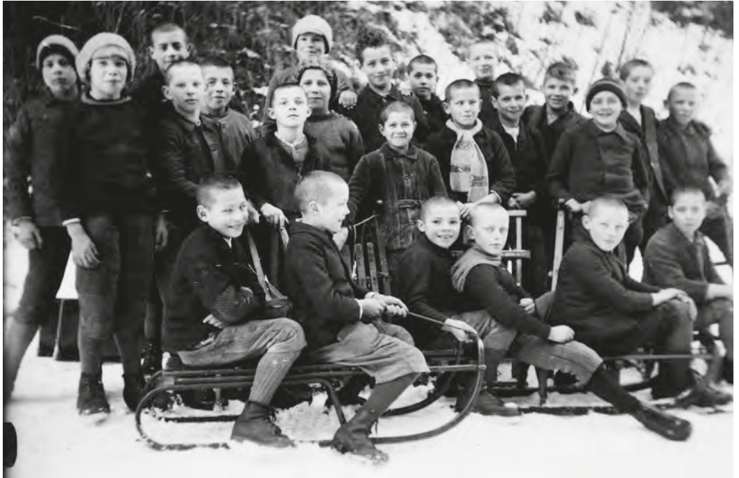
Abb. 30: Zu den Freizeitaktivitäten im Winter gehörten auch Schlittelpartien. Auf der Fotografie von 1927/1928 sind Knaben der «Oberschule» abgebildet.

fahren im Winter. 412 Sportgeräte waren allerdings Mangelware oder kaum mehr brauchbar, reichten jedenfalls noch um 1960 nicht für alle. 413 Das Baden im oberen Weiher war nach einem tödlichen Badeunfall im Jahr 1940, der ein gerichtliches Nachspiel gehabt hatte, verboten worden, 414 und «nach Wil ins Schwimmbad, das wäre zu teuer gewesen, das konnten wir nicht». 415 Damit dennoch gebadet werden konnte, wurde die Murg gestaut. 416 Von ehemaligen Zöglingen und den Erziehenden meist positiv beur-