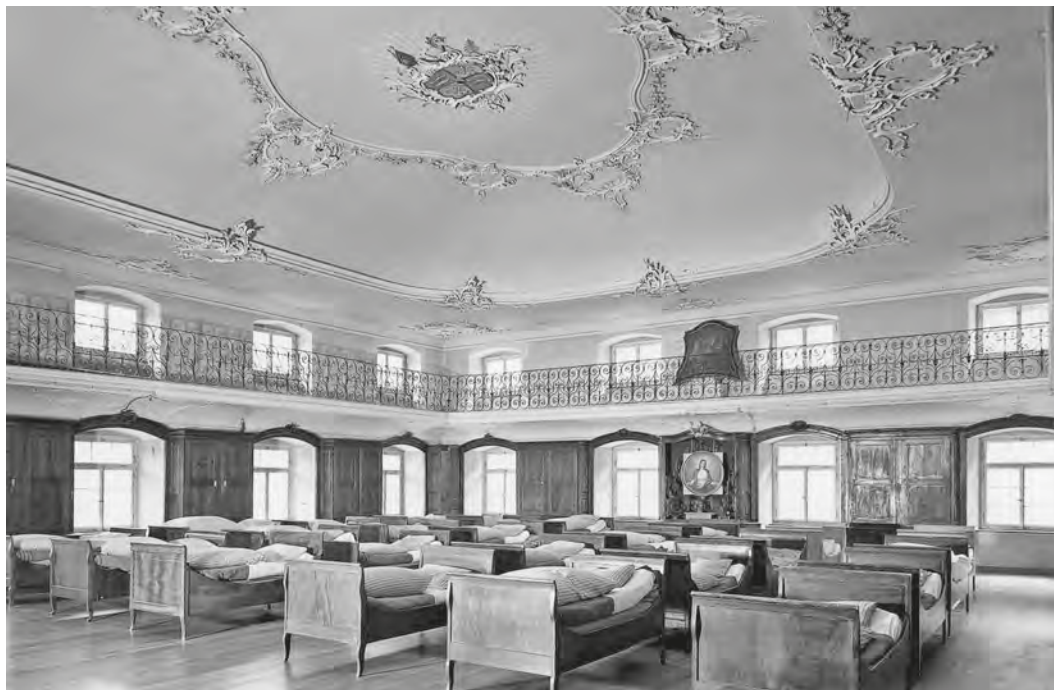
Abb. 24: Der grosse Schlafraum in der alten Bibliothek, in dem die Realschüler bis 1978 schliefen.

gingen. 363 Bei der Rückkehr schliesslich musste man «fast alles, was man mitgebracht hat, abgeben, vor allem Schriftliches. Briefe wurden auch gelesen.» 364