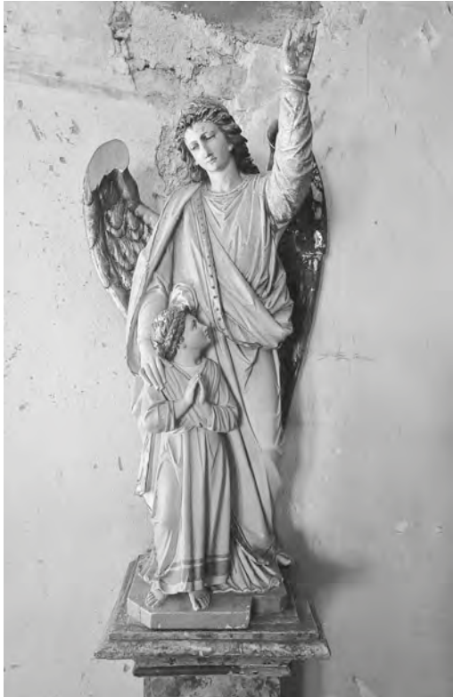
Abb. 35: Jedes Kind in St. Iddazell kannte die den Heimzweck versinnbildlichende Statue des Engels mit dem von einem Brandunglück angesengten Flügel, der seine schützende Hand auf das Kind legt. So sehr die Religion in St. Iddazell allgegenwärtig war, so sehr hätten sich viele im Alltag einen Schutzengel gewünscht.

sämtlicher zahlreich anwesenden Aktionäre & vielen Volks». 459