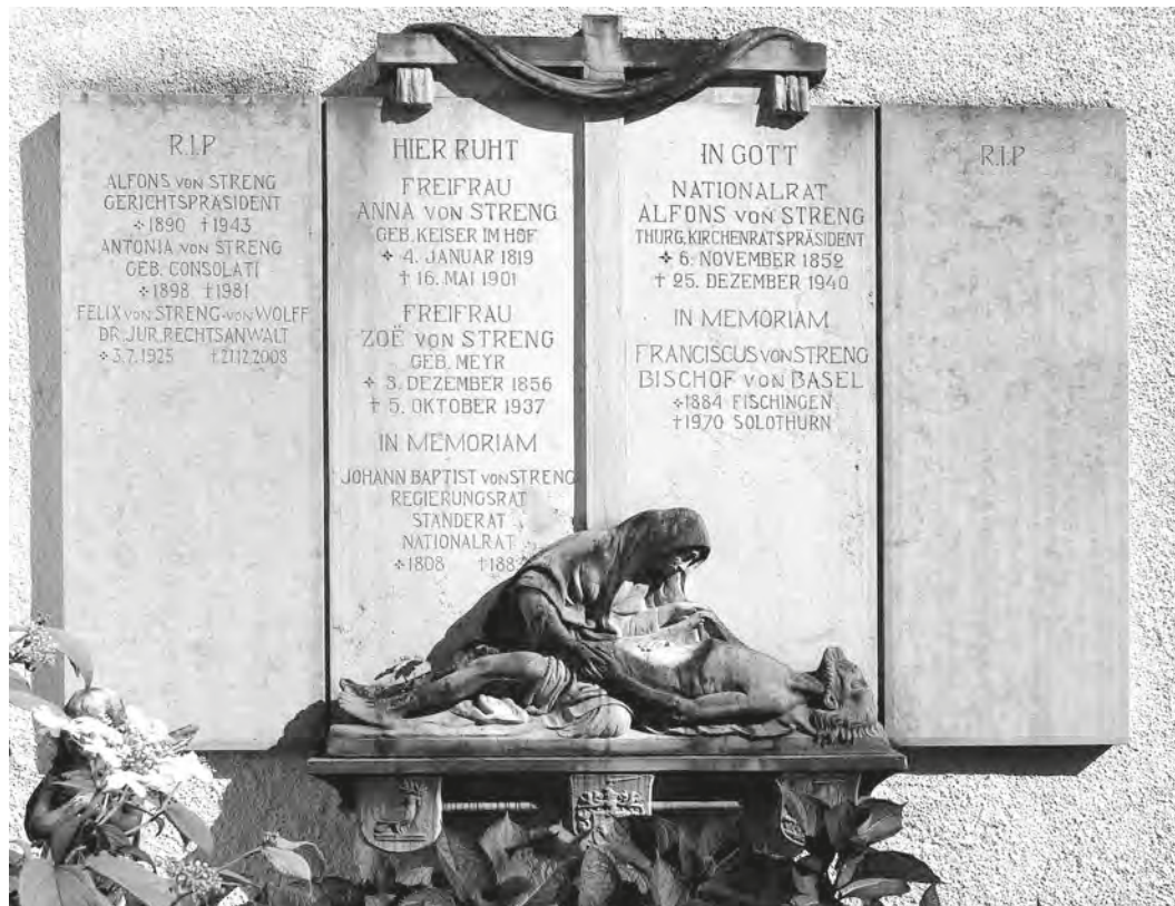
Abb. 11: Von der Gründung an stellten verschiedene Mitglieder der Thurgauer Familie von Streng, die bedeutende Funktionen in Kirche und Staat innehatten, eine grosse Stütze des Heims St. Iddazell dar. Zeugnis dieser starken Verbundenheit ist die Grablege an der Kirche.