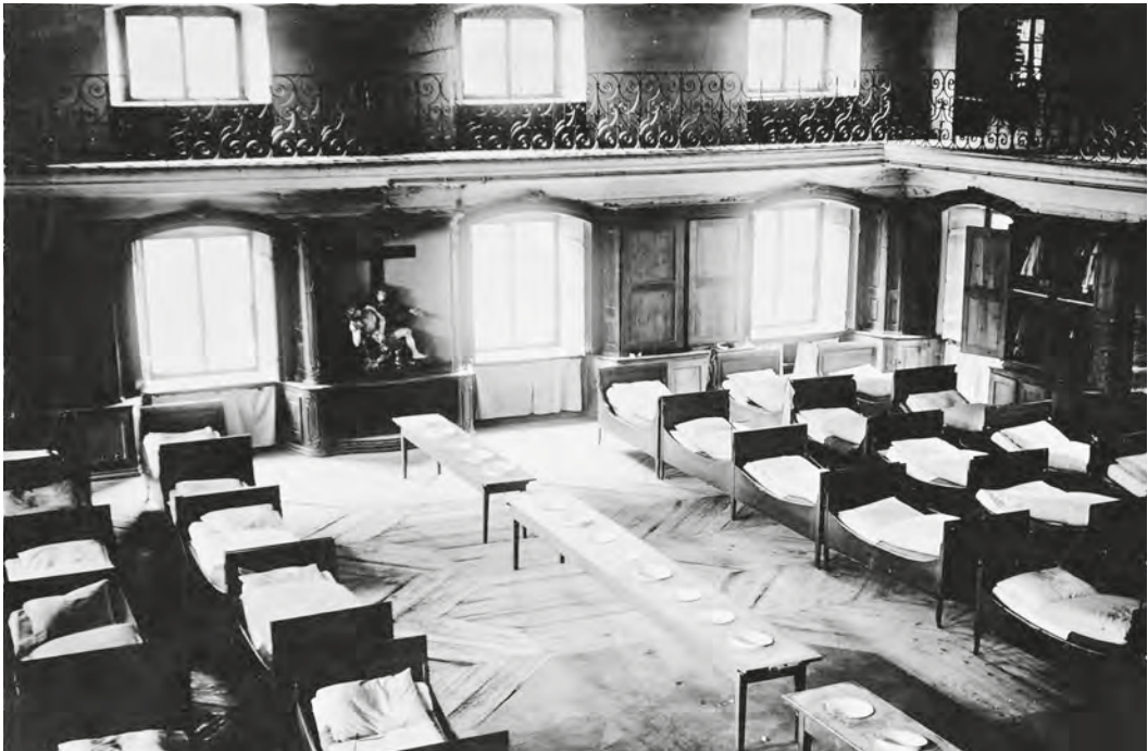
Abb. 32 bis 34: Die hygienischen Verhältnisse liessen bis in die 1960er-Jahre zu wünschen übrig. Zeitweise stand in der Bibliothek eine lange Reihe mit Waschtischen (Abb. 32). Die auf Abb. 33 und 34 wiedergegebenen Wasch-, Bade- und Duschanlagen – die Fotografien wurden für Prospekte angefertigt – entsprachen nicht dem allgemeinen Standard im Heim.

dewannen eingerichtet worden, 451 doch war dies nicht ausreichend für die zahlreichen Insassen. Bezeichnenderweise war es noch 1948 eine Erwähnung im Jahresbericht wert, dass im Waschraum der Ober- und Mittelschule zwei neue Waschtröge eingerichtet worden waren. 452 Wenn überhaupt einmal geduscht werden konnte, so geschah dies abteilungsweise und unter Aufsicht. Eine Ehemalige erinnert sich an die Waschprozedur: «Und wir hatten genau 5 Minuten Warmwasser, und nachher kam kalt. Und – man hat dann pressiert, also – äh – damit man nicht ins kalte Wasser hinein kam. Es ging sehr «tífing». Und es war immer jemand dabei. Das kommt noch dazu. Sie schaute dann immer noch und sagte «ja, du hast dich da noch nicht gewaschen, und du hast dich da noch nicht gewaschen». 453 Zehn Jahre