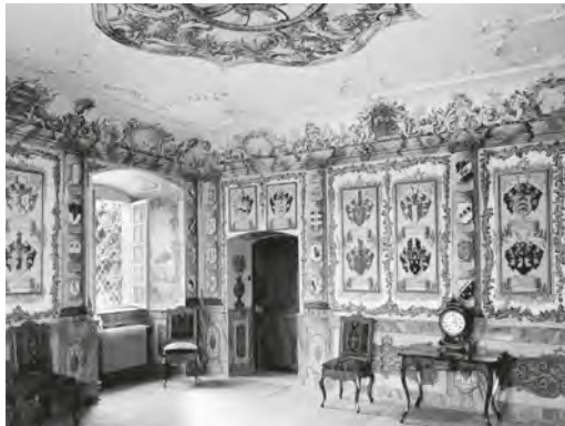
Abb. 3: Das sogenannte Wappenzimmer in der Südwestecke im Parterre neben der Kanzlei wurde in der Zeit des Fischinger Heims als Büro und Besprechungsraum genutzt. Aufnahme von 1954.

schulisch stark gefördert. So durfte er als einziger die Sekundarschule in Oberwangen besuchen, wohin er mit dem eigenen Fahrrad fuhr. Nur schon dadurch genoss er gewisse Freiheiten gegenüber den anderen Zöglingen. Den Dienst als Ministrant, der ihn aus der Masse ebenfalls etwas heraushob, versah er zwar eher widerwillig, doch durfte er gelegentlich mit einem Mitzögling die Milchkannen vom Hof auf dem Chilberg mit einem Pferdefuhrwerk in die Milchzentrale transportieren, eine Aufgabe, die ihn ebenfalls vor andern auszeichnete und die er sehr gerne ausführte. An unangenehme Arbeitseinsätze kann er sich kaum erinnern, viel eher an ein sportbetontes Freizeitprogramm. Sodann wurde er in seiner Abteilung nie Zeuge von Gewalt. Während er sich an eine durchweg schöne Zeit erinnert und gerne daran zurückdenkt, verbrachte seine vier Jahre jüngere Schwester in den beiden Mädchenabteilungen für die Kleinen und für die Grossen zweieinhalb dunkle, bedrückende Jahre, die geprägt waren von Gefühlskälte, Strafen und nächtlichen sexuellen Übergriffen des Personals an Mitzöglingen. 37 Die Gegensätzlichkeit der Berichte könnte grösser nicht sein und sogar den Eindruck erwecken, die beiden seien gar nicht im gleichen Heim gewesen. Sie selbst zweifeln ihre jeweils andere Erfahrung in keinem Moment an und