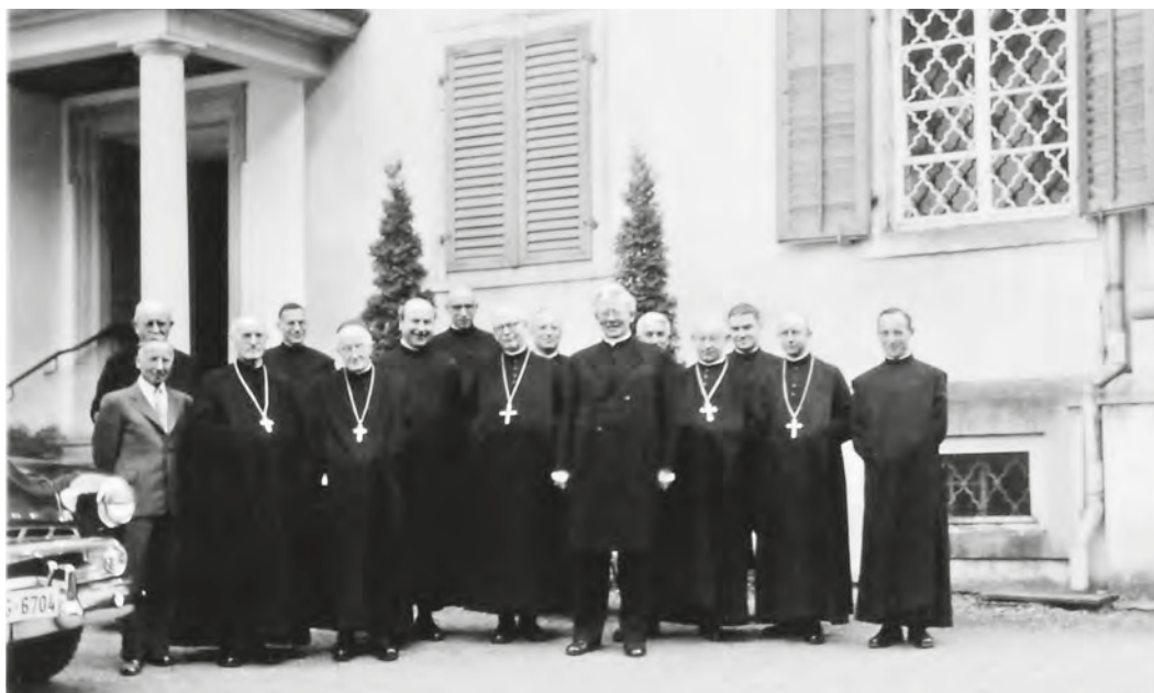
Abb. 10: St.Iddazell beherbergte immer wieder illustre Gäste. Im Juni 1954 hielten im ehemaligen Kloster die Schweizer Benediktineräbte eine Tagung ab.

betrieb fuhr Ende der 1950er-Jahre aber auch Verluste ein. 165