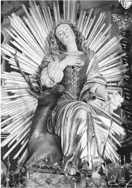
Abb. 37: Der Erziehungsalltag im Heim liess dem geistlichen Personal weit weniger Zeit für seine religiösen Pflichten als im Kloster. Trotzdem bildeten sie einen festen Bestandteil ihres Alltags. Die Abbildung zeigt eine Figur der Heiligen Idda von Toggenburg, der zu Ehren die Iddakapelle in der Fischinger Klosterkirche errichtet worden war und die im religiösen Leben des Heims eine wichtige Rolle spielte.

hätte, könnte ich all die gestellten Aufgaben wohl kaum bemeistern.» 776