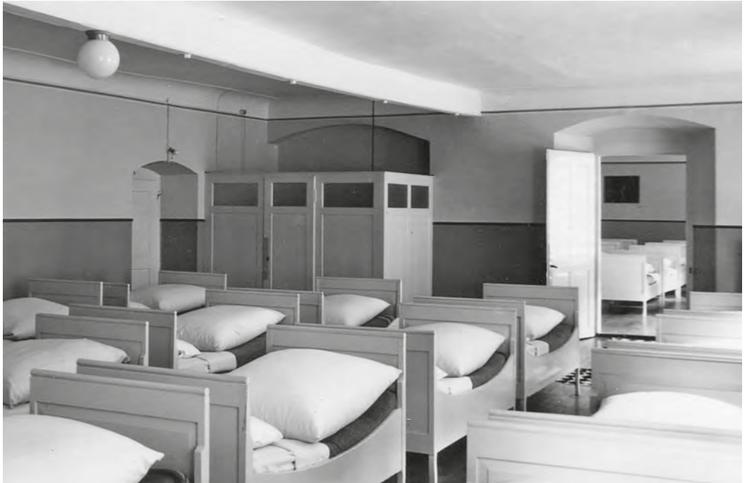
Abb. 39: Hinten an der Wand stand ein Verschlag, in dem die Erzieherin schlief und beide Schlafsäle überwachen konnte.