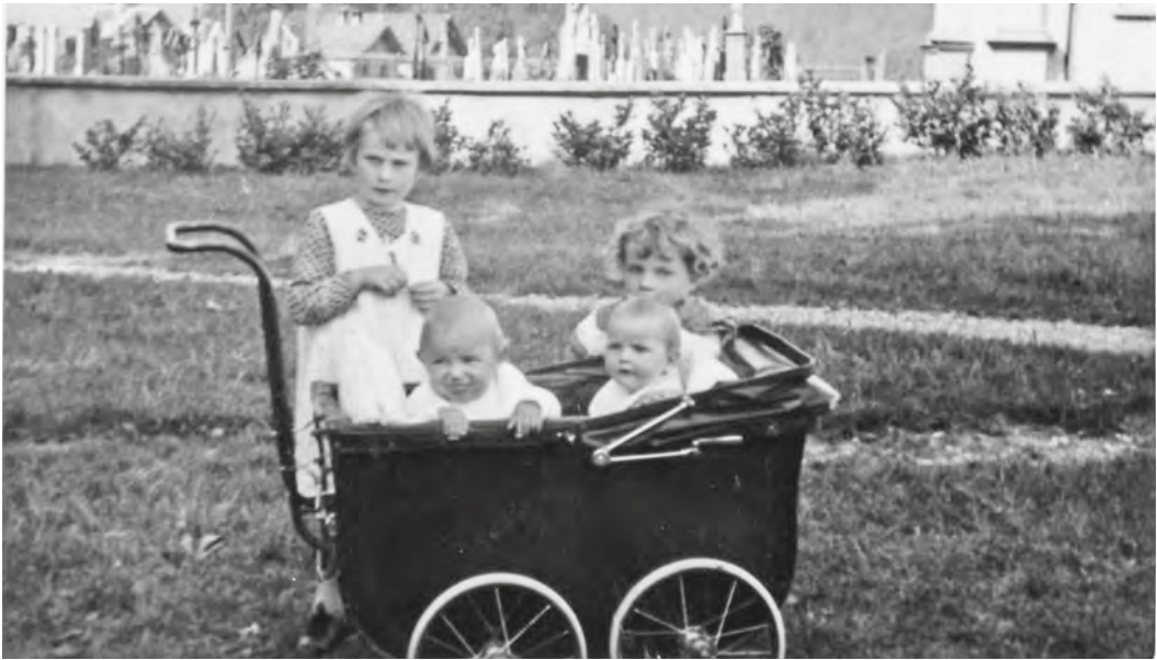
Abb. 5: Um dem Rückgang der Zöglingszahlen zu begegnen, wurde 1894 eine Säuglings- und Kleinkinderabteilung eingerichtet sowie das Kostgeld von zwei auf einhalb Franken pro Tag reduziert. Die Fotografie stammt aus dem Jahr 1939. In den 1950er-Jahren wurde die Säuglingsabteilung wieder geschlossen.

Praxis umzusetzen vermochte, ist allerdings nicht bekannt. 85