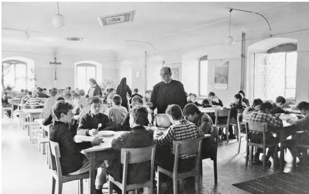
Abb. 31: In den 1960er-Jahren wurden nur noch die grösseren Knaben im grossen Speisesaal verköstigt.

der gebotenen Verpflegung nichts auszusetzen haben, weil sie nie etwas anderes gekannt hatten, 442 ruft dieses Thema bei anderen schlechte Erinnerungen hervor. Vor allem jene, die in den 1930er- und 1940er-Jahren in Fischingen waren, berichten über schlechte und eintönige Kost auf Blechtellern. Aufgetischt wurden hauptsächlich Kartoffeln. «Das Essen war so schlimm», konstatiert eine Ehemalige. «Es gab täglich Mangold und Kartoffeln und Kartoffeln und Mangold, [...] das Brot zog Fäden.» 443 Zum Abendessen reichte man damals «geröstete Haferflocken und Apfelmus. Das gab es praktisch zu jedem Znacht. Das roch man dann schon am Nachmittag um vier im ganzen Haus.» 444 Fleisch gab es selten, am ehesten noch am Sonntag, unter der Woche vielleicht einmal «Schwartenmagen». 445 Der Speiseplan war ganz besonders während der Ratio-