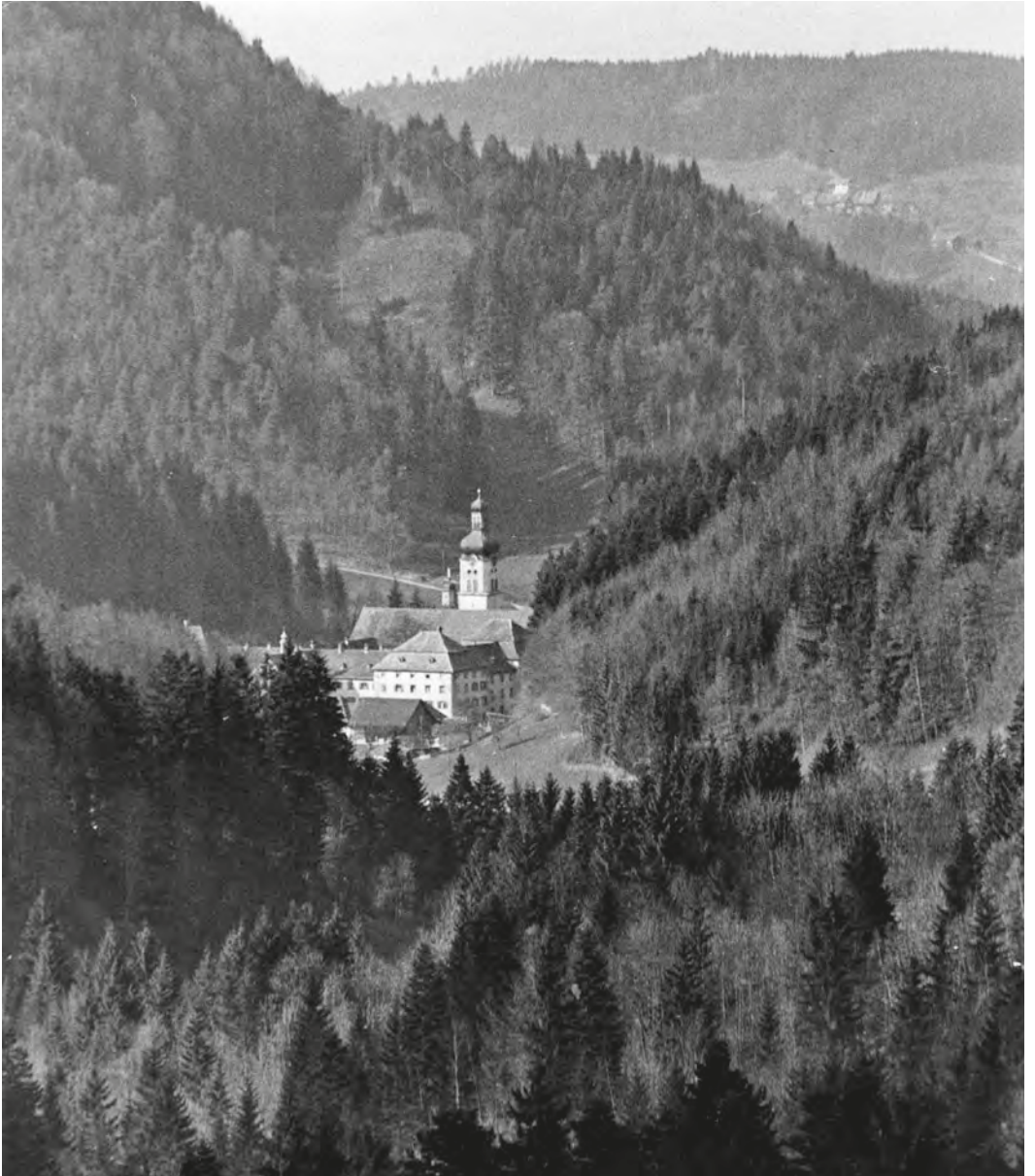
Abb. 40: Das Kinderheim St. Iddazell lag weit abgelegen, hinten im sogenannten Tannzapfenland.