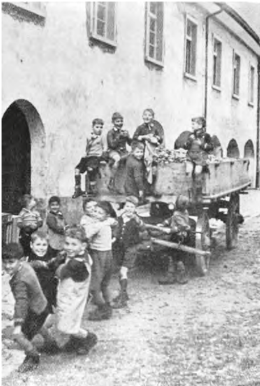
Abb. 14: Jedes Jahr im Herbst führte St.Iddazell im Thurgau eine Apfelsammlung durch, die jeweils von den Kanzeln herunter angekündigt wurde.

sen. 246 Zur finanziellen Rolle der Landwirtschaft lassen sich so kaum Schlüsse ziehen. Von 1920 bis 1936 sind beispielsweise Einkünfte aus dem Landwirtschaftsbetrieb überliefert, die wahrscheinlich die Viehwirtschaft und den Gemüseverkauf betreffen. Aus diesen Zahlen lässt sich schliessen, dass in dieser Zeit die Landwirtschaft einen wichtigen Bestandteil mit bis zu 33,6 Prozent (1920) der Einnahmen ausmachte. 247 Aus den folgenden Jahren sind keine solchen Zahlen überliefert. Die Einkünfte aus den Viehverkäufen hingegen lassen sich eher rekonstruieren. Sie machten bis zu 6 Prozent (1900) des Einkommens der Anstalt aus, 1940 waren es immerhin noch 4,3 Prozent oder rund 2174 Franken.