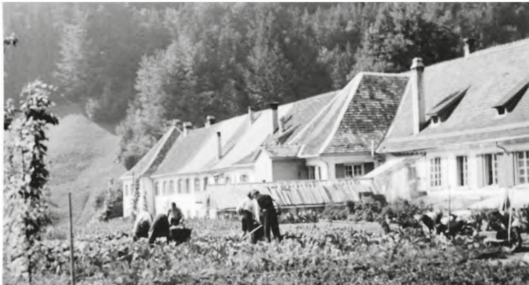
Abb. 13: Auf den Tisch in St. Iddazell kam hauptsächlich Gemüse aus der eigenen Gärtnerei. In der Aufnahme von 1939 sind Personen bei der Arbeit und das Treibhaus vor dem alten Wirtschaftsstrakt zu sehen. Zur Anstalt gehörten weitere Betriebe, die durch Verkauf der Produkte zum Unterhalt sowie zur Selbstversorgung beitrugen. Neben landwirtschaftlichen Produkten wie Milch war dies vor allem auch Holz aus den anstaltseigenen Wäldern.

nannte Schwererziehbare, was für die Neuausrichtung des Kinderheims St. Iddazell in den 1960er-Jahren mitentscheidend gewesen sein dürfte. 243