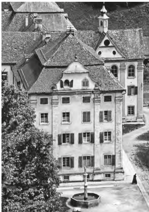
Abb. 12: Der sogenannte Abttrakt im Vordergrund erfuhr in der Zeit des Kinderheims keine substanziellen baulichen Veränderungen. Die beiden oberen Stockwerke werden seit 1977 vom damals gegründeten Benediktinerpriorat genutzt.

das absolut Notwendigste unterhalten, denn das ferne Ziel der Klosterwiedereröffnung erlaubte keine Eingriffe in die Bausubstanz, die den Charakter des Klosterbaus, beispielsweise die Mönchszellen, zerstört hätten. Die früheren geistlichen Direktoren legten neben den dringenden Arbeiten an den Sanitäranlagen, die durch den Kanton geprüft wurden, ihre baulichen Schwerpunkte auf die Renovation der Klosterkirche und der Kapelle sowie auf die Instandsetzung der Aussenfassaden des Klostertrakts. Direktor Jakob Bonifaz Klaus liess 1890 gar eine neue Kapelle, die Iddakapelle am nördlichen Hang der Otteneegg, bauen. 221 Auch beim Sonderschulheim Chilberg wurde in den 1970er-Jahren eine Kapelle fix eingeplant. 222