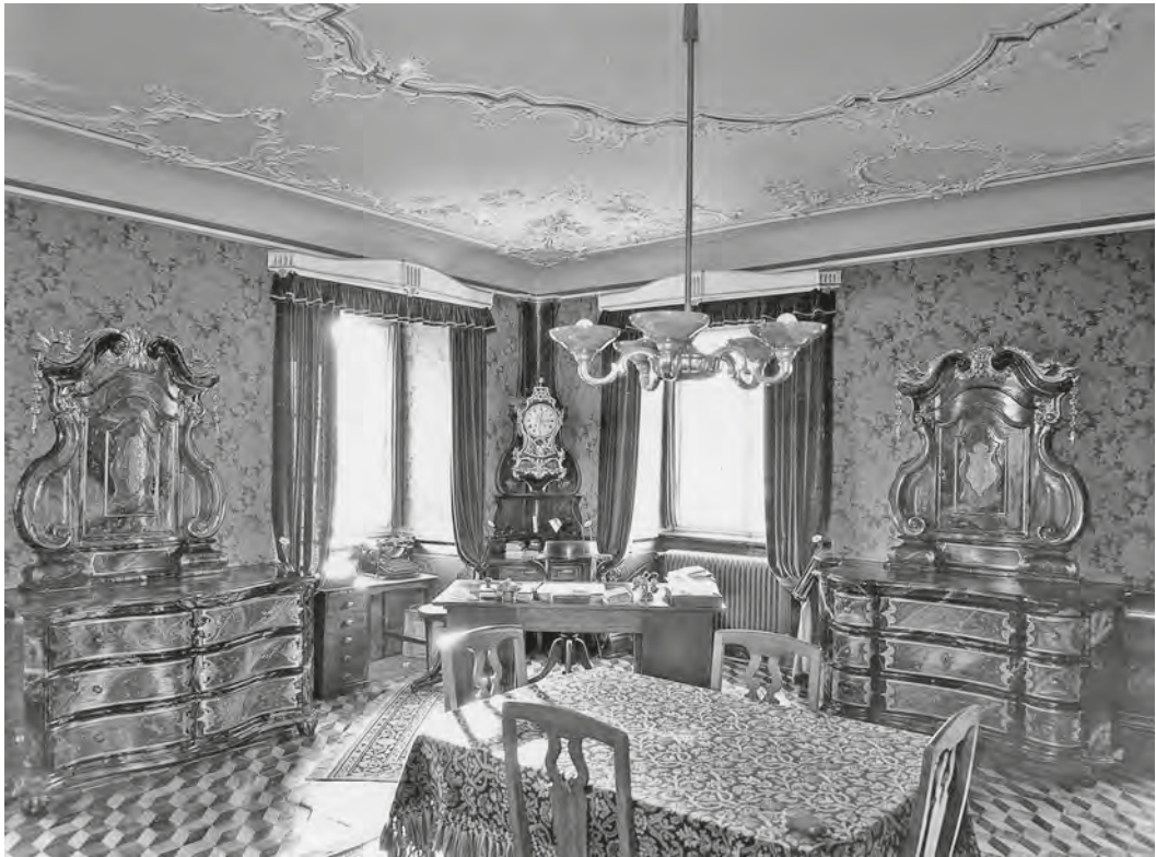
Abb. 18: In dem mit einem dekorativen Parkettboden, einer kunstvoll gestalteten Rokoko-Stuckdecke, auserlesenen Tapeten, wertvollem Mobiliar und einer grossen Pendule ausgestatteten Prunkzimmer im ersten Stock in der Südwestecke weisen nur die beiden Schreibtische und die Schreibmaschine darauf hin, dass es sich um das Büro des Direktors handelt.

gen als auch die Kompetenzregelung mit den Menzinger Schwestern allein in den Händen des Direktors. 280 Die bereits in den Gründungsstatuten festgeschriebene Machtfülle des Direktors blieb erhalten, ja wurde mit dem «absoluten Rechte der Befehlsgebung» im Vertrag von 1920 sogar noch verstärkt. 281 Die Menzinger Schwestern hingegen blieben in diesen Statuten unerwähnt, ebenso die Festlegung und Handhabung der Hausordnung.