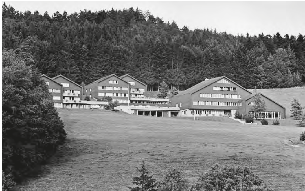
Abb. 8: Mit der Einweihung des Sonderschulheims Chilberg im Mai 1976 setzte der Auszug der Kinder aus den Klosterräumlichkeiten ein. Zwei Jahre später zogen auch die Realschüler in die freigewordenen Räumlichkeiten im ehemaligen Ökonomiegebäude um, so dass das Kloster nur noch von den Mitgliedern des 1977 gegründeten Benediktinerpriorats ständig bewohnt wurde.

wiederum die Konkurrenz durch andere Heime, das aufgrund der Teuerung höhere Kostgeld oder der Geburtenrückgang, die Zunahme der Privatversorgungen, aber auch das fehlende Vertrauen der Versorger in die Anstalt angesichts offensichtlicher Mängel unter dem damaligen Direktor genannt. 119